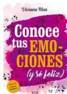
Conoce tus emociones Viviana Blas